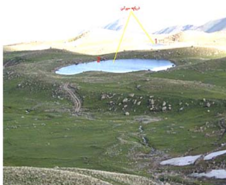
شکل ۱۰ دریاچه سیرکی ( تارن) به قطر حدود ۶۰ متر، دامنه جنوب شرقی (سیلان، ۲۳ خرداد ماه ۱۳۸۴. نمای روبه شمال و شمال شرقی).