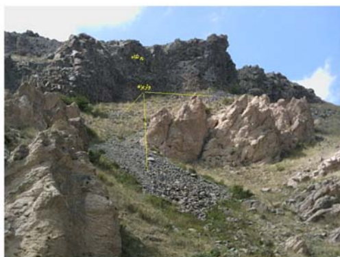
شکل ۵ پوشش واریزه در دامنه شرقی سبلان با نمای روبه جنوب منطقه سردابه. (ارتفاع ۲۰۲۰ متر)

همان‌طوری که ملاحظه می‌شود؛ هواز دگی ناشی از عملکرد یخبندان در پرتگاه‌ها، همراه با سایر فرآیندهای هواز دگی، منجر به جدایی بلوک‌ها یا قطعات سنگ شده است. این فرآیند زمانی بوجود آمده است که درجه حرارت، بعد از اینکه به مدت یک دوره زیر صفر بوده؛ سریعاً افزایش یافته و به بالای صفر درجه رسیده است. بدین ترتیب سنگ‌ها از راس دیواره‌ها به سمت پایین حرکت کرده‌اند.