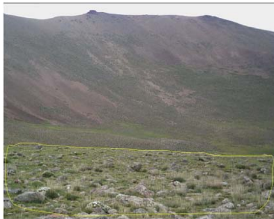
شکل ۳ پوشش گیاهی و ریگولیت، که شامل قطعات سنگی نسبتاً درشت در یک ماتریس درشت دانه است. (دامنه شرقی سبلان، قسمت مقدم تصویر).

ساختمان داخلی این سنگ‌ها، همچنین عملکرد شکستن و خرد شدن آن‌ها (ناشی از یخبندان)، فرآیند مهمی در جداسازی قطعات از سنگ بستر می‌باشد و این عوامل ویژگی‌های ریگولیت را کنترل می‌کنند.