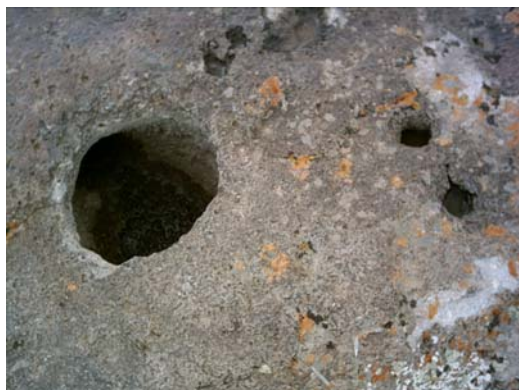
شکل ۴ تافونی در سطح سنگ، دامنه شرقی سبلان ارتفاع ۳۴۱۰ متر.

آندزیت است. خلل و فرج موجود در این سنگ‌ها، همچنین عمل خشک شدن و مرطوب شدن متوالی این سنگ‌ها بواسطه بارندگی و رطوبت هوا؛ سبب توسعه این چاله‌ها شده است.