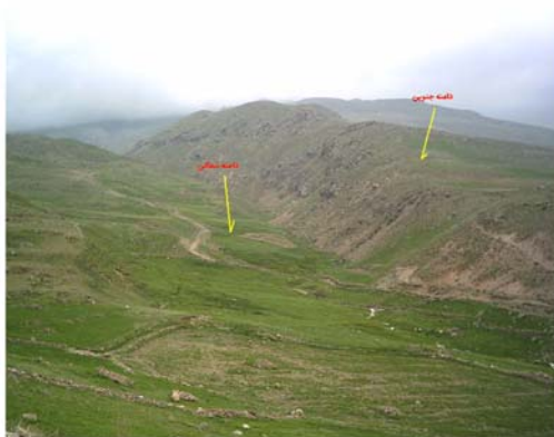
شکل ۱۱ دره نامتقارن با جهت شرقی - غربی در دامنه شرقی سیلان (دیواره سمت راست دامنه رو به جنوب و دیواره سمت چپ دامنه رو به شمال با شیب ملایم)

نمونه های متعددی از چنین دره هایی در دامنه شرقی سیلان (در ارتفاعات و در محدوده پریگلاسیر) در حال تشکیل هستند. اما از آنجا که چنین دره هایی دارای عمق کمتری هستند و چندان طویل نمی باشند، نمی توان در چنین محدوده هایی دره های نامتقارن مشخصی را معرفی نمود.