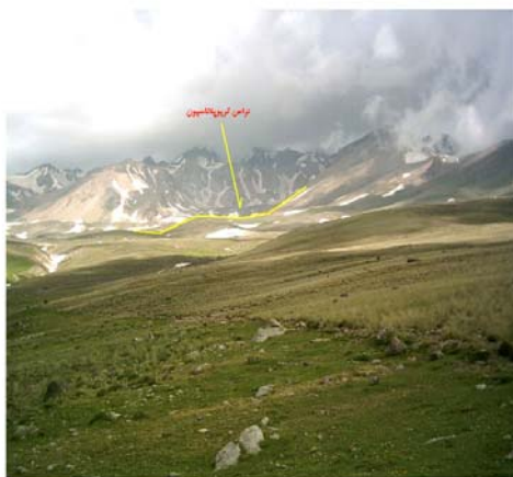
شکل ۸ تراس کریوپلاتاسیون در دامنه جنوب شرقی سبلان ( ۱۹ تیر ماه ۱۳۸۳، ارتفاع در حدود ۳۴۰۰ متر).

شکل ۸ تراس کریوپلاتاسیون ۲ (تراس هموارشده برفی) را نشان می دهد، که دامنه ملایمی بوده و شیب تندی بر آن مسلط می باشد. نیواسیون عموماً به عنوان مکانیسمی است که پسروی پرتگاه را تسریع می کند تا به صورت تراس یا پایکوه توسعه یابند (کلارک ۱۹۸۸).