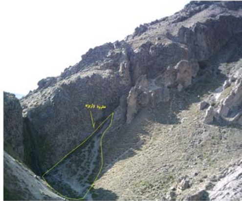
ارتفاع ۲۰۱۰ متر. (سمت چپ تصویر)

ابتدا سنگ بستر روباز به واسطه گوه‌های یخی به قسمت‌های مختلف تقسیم شده و سپس خرد شده است. و چون زمانی که سنگ‌ها خرد می‌شوند، شکسته شده و آزاد می‌شوند، بنابراین نیروی ثقل موجب افتادن و معلق شدن آن‌ها به سمت پایین دامنه‌ها می‌شود. شکل ۶ مخروط واریزه را در دامنه شرقی سبلان نشان می‌دهد.