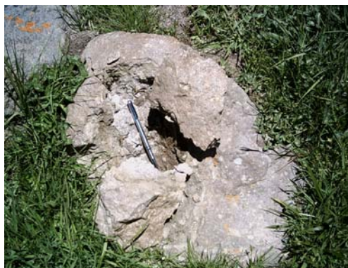
شکل ۲ تخریب مکانیکی سنگ در دامنه شرقی سبلان

علاوه بر نوسان دمای ماهانه و عملکرد یخبندان، نوسان روزانه دما نیز می تواند در هواز دگی مکانیکی دخالت نماید. اگر چه میدان عمل آن نسبت به بقیه کمتر می باشد؛ اما زمینه را برای هواز دگی مکانیکی گسترده تر آماده می کند. شکل ۲ هواز دگی مکانیکی سنگ را در دامنه شرقی سبلان نشان می دهد. در این شکل هواز دگی ناشی از نوسان دما و عمل ذوب و یخبندان کاملاً مشهود است.